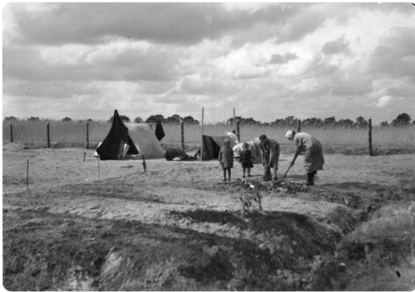
Berlin, Stadtrandsiedlung, Feldarbeit