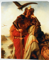
Q2 Wislicenus Germania, 1873