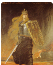
Q3 Germania, 1914