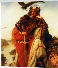
Q2 Wislicenus Germania, 1873 (Wikimedia, CC-0) https://t1p.de/hnom