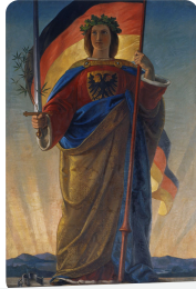
Q1 Germania in der Paulskirche, 1848 (Wikimedia, CC-0) https://t1p.de/xpyb

(Symbole, Erscheinungsbild, Hintergrund, Perspektive, Zeit, etc.)