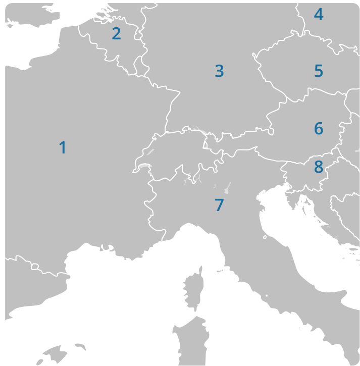
Blank Map of Europe, Wikipedia

② Verbinde folgende Flüsse durch Striche mit dem passenden Kontinent! / 4