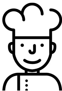
Icon made by Freepic – www.flaticon.com