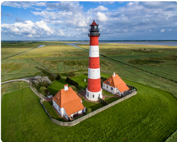
Leuchtturm in Westerheversand

① Der echte Leuchtturm in Westheversand ist 40 m hoch.