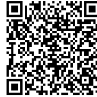
Bauwerk 3: Dom, Berlin