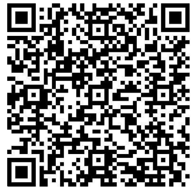
Radiosendung: Wozu brauchen wir Globalgeschichte?