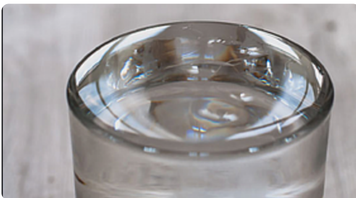
Hier kann man die Oberflächenspannung des Wassers gut sehen.

Ohne die Oberflächenspannung hätten wir keine Regentropfen.