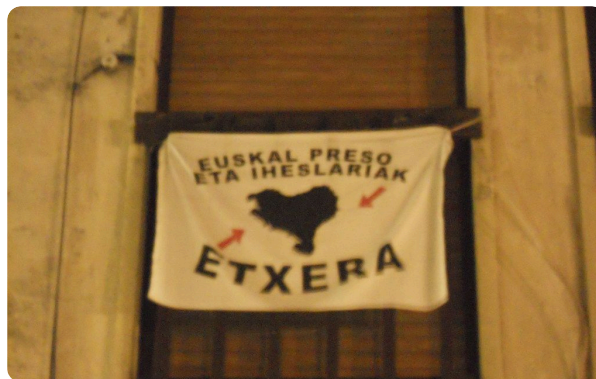
Ejemplo de la lengua vasca

⑧ Aquí encuentras un ejemplo de la lengua vasca. ¿Entiendes algo? ¿Qué crees de qué se trata? Búscala traducción en internet y escríbela abajo (en alemán y español).