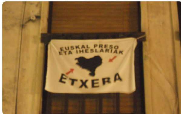
Ejemplo de la lengua vasca

⑧ Aquí encuentras un ejemplo de la lengua vasca. ¿Entiendes algo? ¿Qué crees de qué se trata? Búscala traducción en internet y escríbela abajo (en alemán y español).