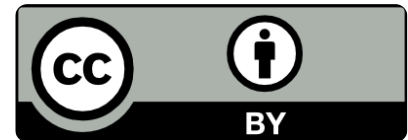
CC BY Logo