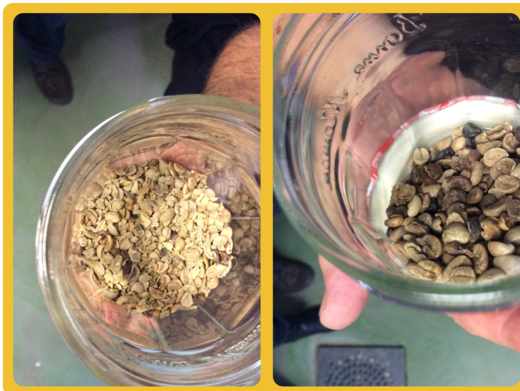
Schlechte Qualität der rohen Kaffeebohnen

Je nach Anbau, Ernte und Aufarbeitung gibt es verschiedene, oft schlechte Qualitäten von Rohbohnen: