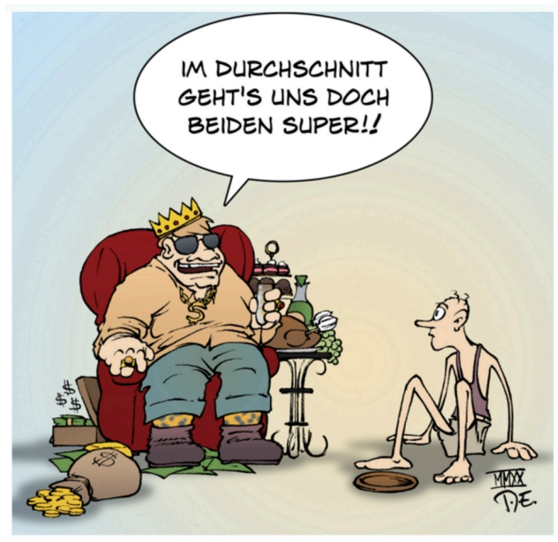
Abb. 1.: Armut