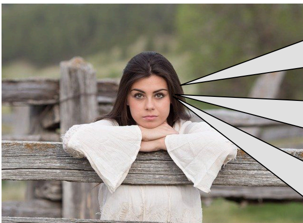
Das junge Mädchen

12 Abschließend: Was sind die Hauptvorwürfe des Mädchens?