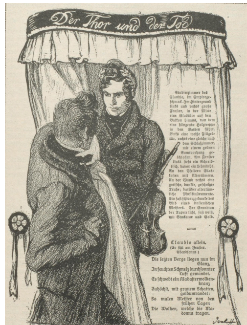
Angelo Jank Hugo von Hofmannsthal Der Thor und der Tod 1899

4 Ausgangssituation: Stelle knapp graphisch dar, wie die Personen zueinander stehen. Welche Art von Kommunikation ist zu erwarten?