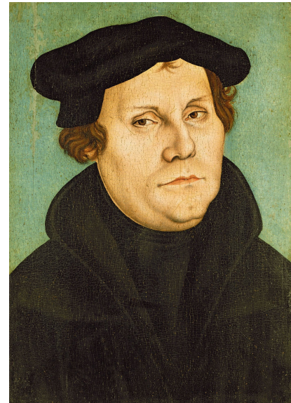
Martin Luther (Portrait aus der Werkstatt Lucas Cranachs des Älteren, 1528)

www.planet-wissen.de/kultur/voelker/geschichte_des_juedischen_volkes/pwieantisemitismusundantijudaismus100.html