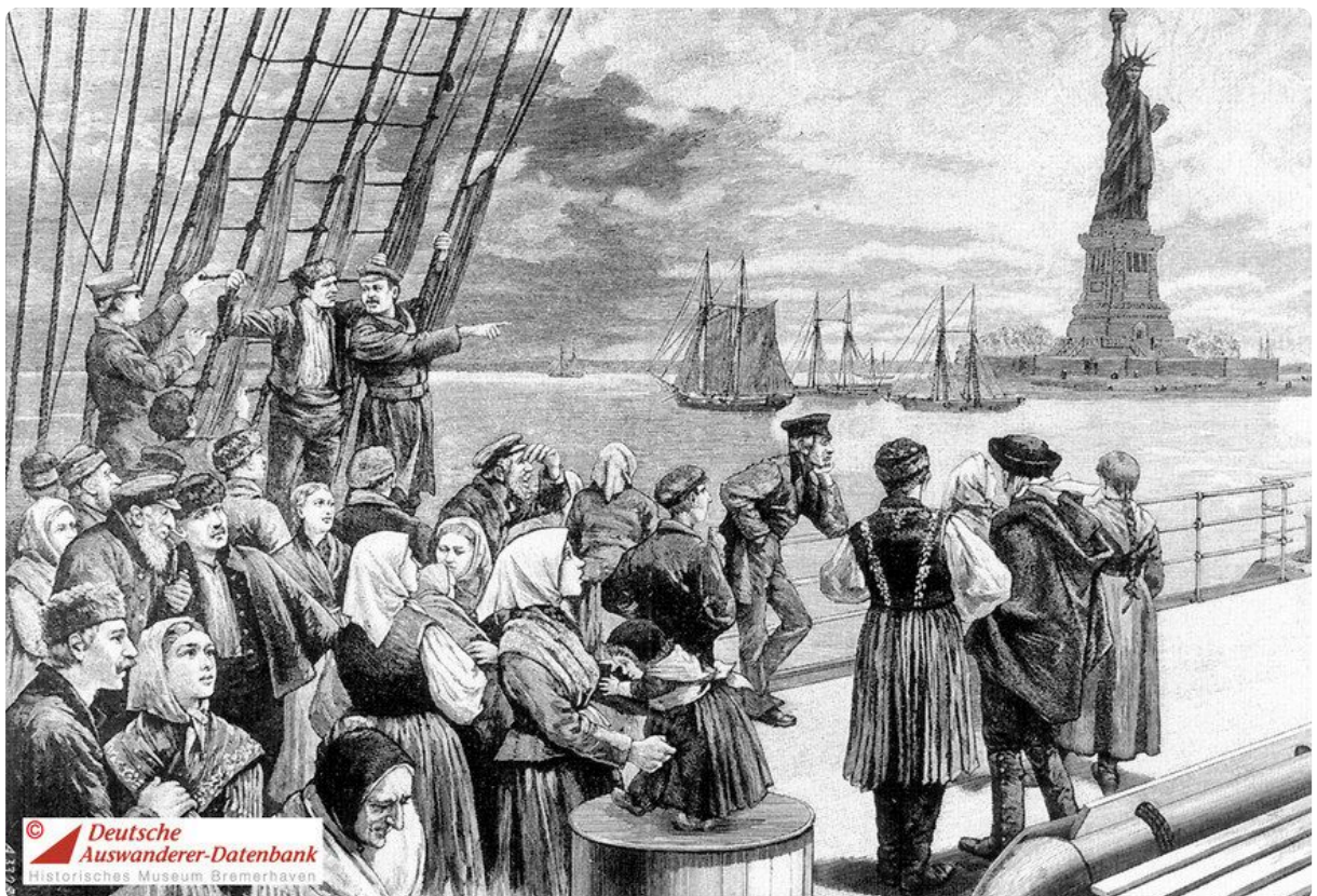
Q1 Ankunft von Auswanderern in New York, Holzstich von 1896