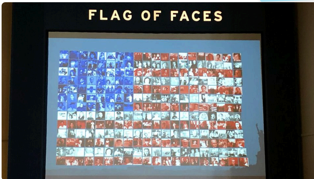
Flag of Faces im Immigration Museum auf Ellis Island, 2019