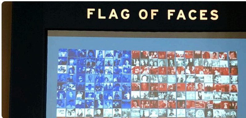
Flag of Faces im Immigration Museum auf Ellis Island, 2019