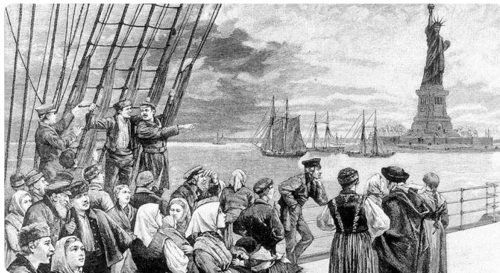
Q1 Ankunft von Auswanderern in New York, Holzstich von 1896