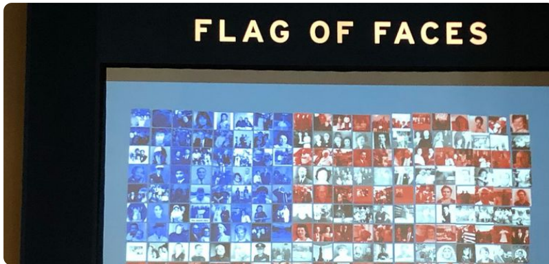
Flag of Faces im Immigration Museum auf Ellis Island, 2019