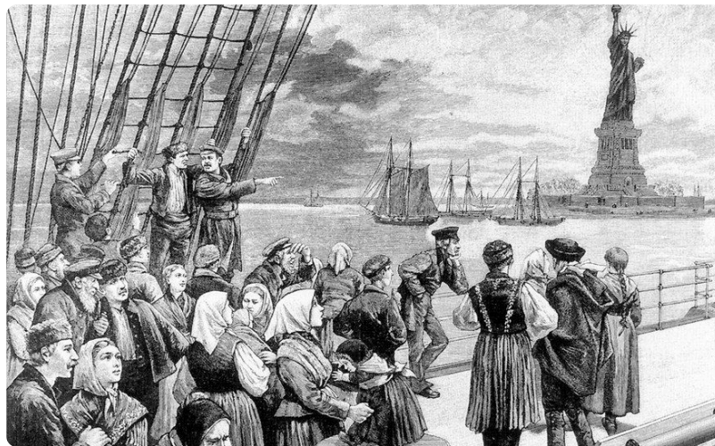
Q1 Ankunft von Auswanderern in New York, Holzstich von 1896