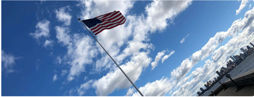
Die gehisste US-Flagge im Liberty State Park, New Jersey, 2019