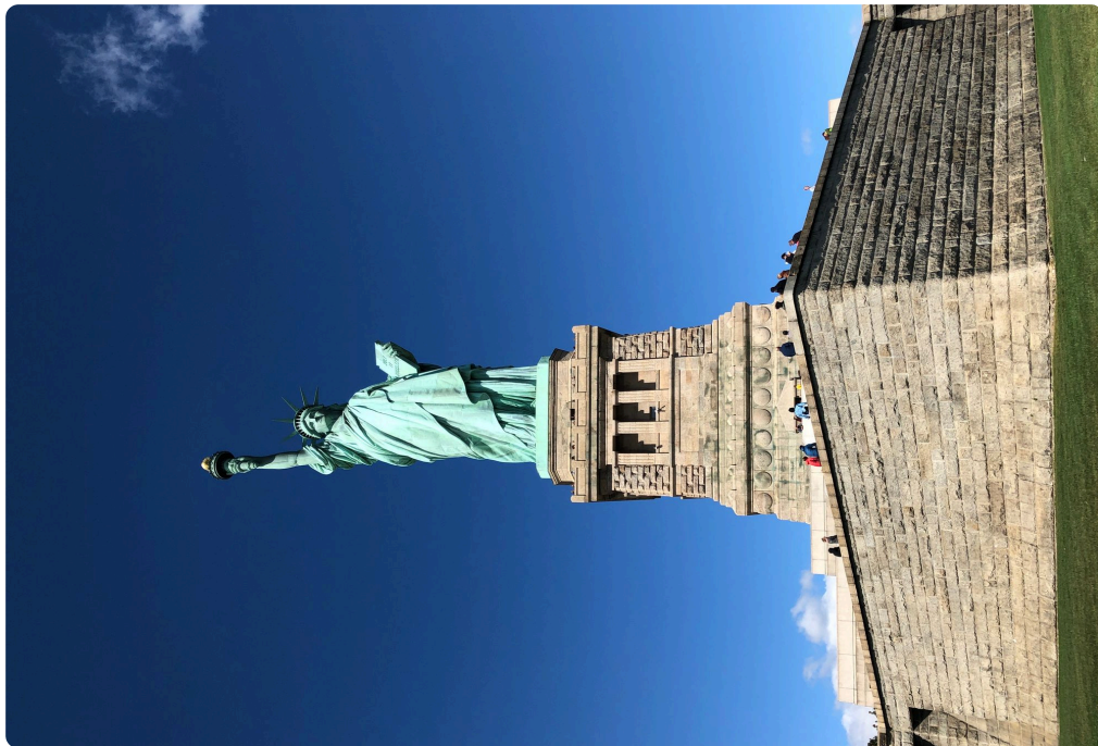
Die Freiheitsstatue auf Liberty Island 2019