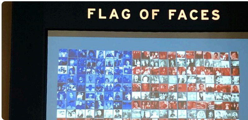
Flag of Faces im Immigration Museum auf Ellis Island, 2019