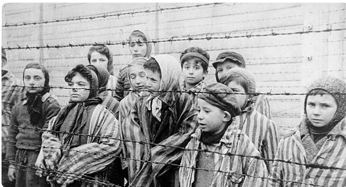
Überlebende Kinder bei der Befreiung des KZ Auschwitz durch die Rote Armee 27.1.1945