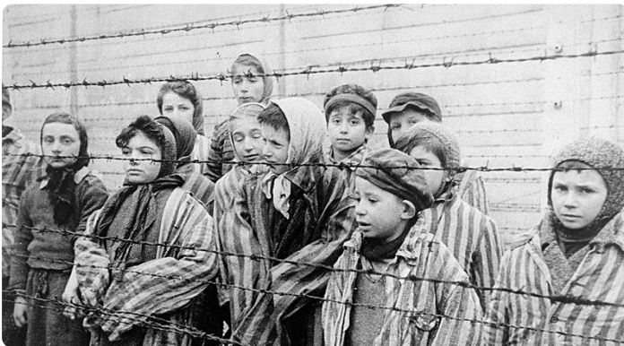
Überlebende Kinder bei der Befreiung des KZ Auschwitz durch die Rote Armee 27.1.1945