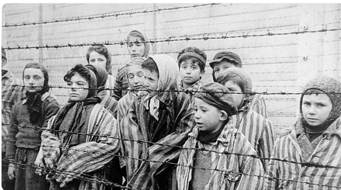
Überlebende Kinder bei der Befreiung des KZ Auschwitz durch die Rote Armee 27.1.1945

3. Phase: Schulschließungen, Deportationen und Ermordung