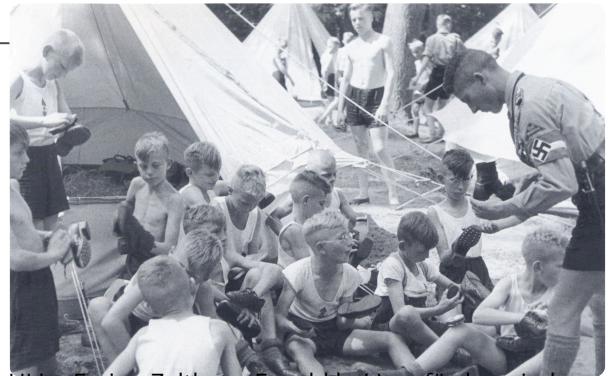
HJ im Ferien-Zeltlager Espohl bei Lemförde zwischen 1933 und 1943