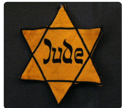
M5 Judenstern 8.2.2005, Bild: Daniel Ullrich, Jüdisches Museum Westfalen, Wikimedia CC-BY-SA 2.0, https://t1p.de/wqnh

(2) Weitergehende polizeiliche Sicherungsmaßnahmen sowie Strafvorschriften, nach denen eine höhere Strafe verwirkt ist, bleiben unberührt.