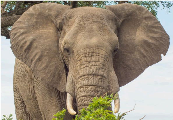
Afrikanischer Elefant ( Loxodonta africana )