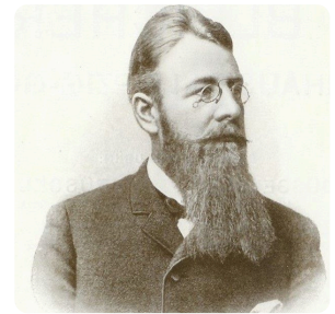
A. Bleichert

Achtet bei der Bildauswahl auf a) den inhaltlichen Bezug zum Thema der Ausstellung b) die Angabe von Jahreszahlen und c) die Nutzung von frei verwendbaren Bildern.