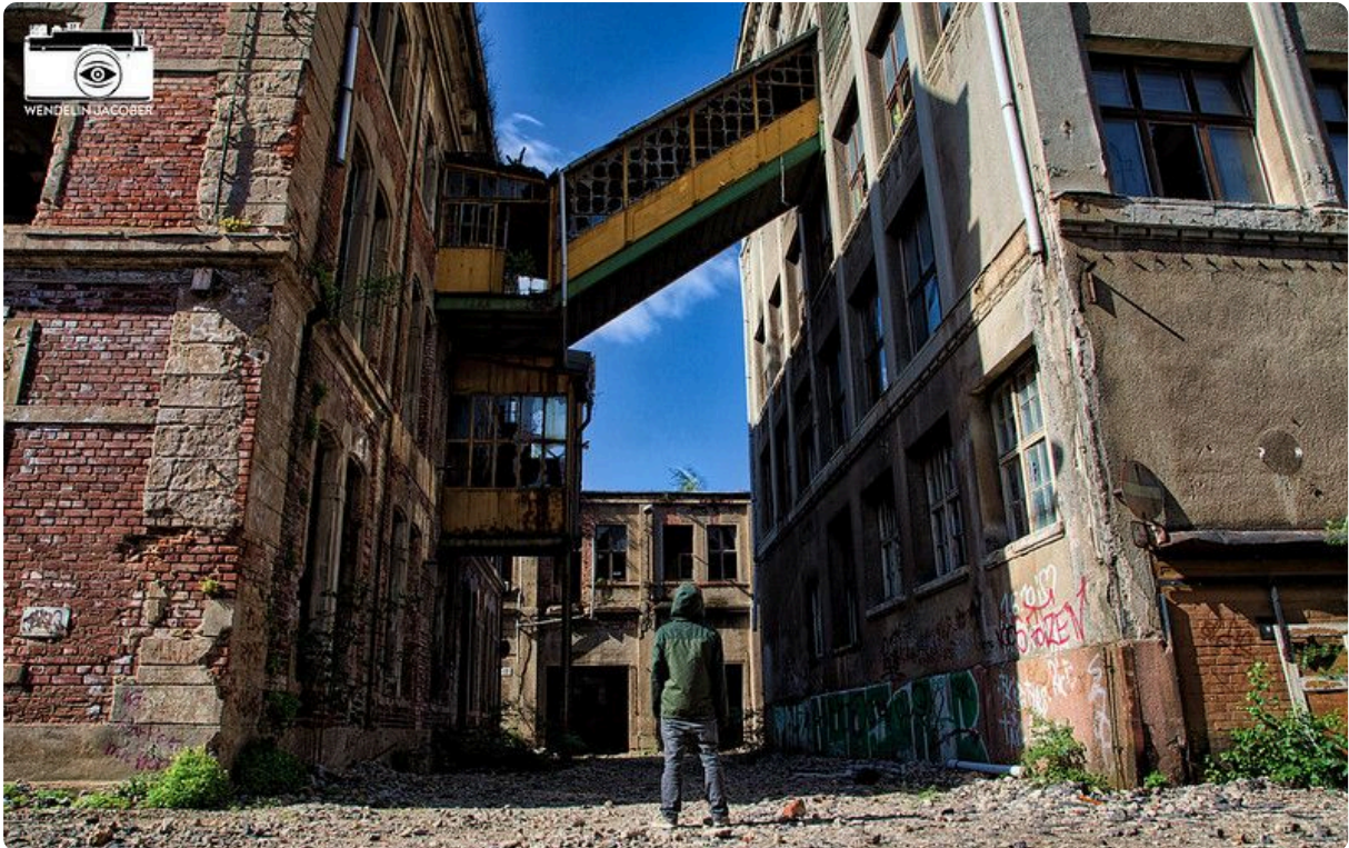
M1 Ehemalige Bleichert-Werke in Leipzig-Gohlis, 2015