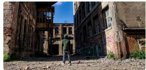
M8 Ehemalige Bleichert-Werke in

Leipzig, 2015