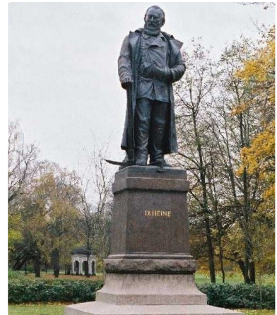
Q3 Carl-Heine-Denkmal in Leipzig

M9: Hier geht's zum Denkmal https://t1p.de/heinedenkmal