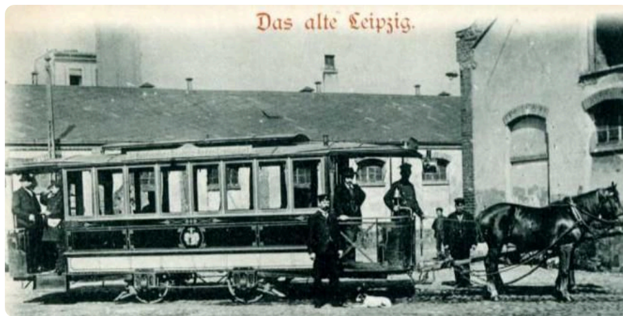
Q5: Das alte Leipzig Foto: Photogr. H. Pechlöffel 1899

Mit der Straßenbahn durch Leipzig zu fahren ist heute ganz normal. Doch das war nicht immer so. Am 18. Mai 1872 begann mit der Eröffnung des Linienbetriebs der Leipziger Pferde-Eisenbahn die Geschichte der Straßenbahn in Leipzig. Das Bild Q4 zeigt dir, wie die Pferdestraßenbahn ausgesehen hat.