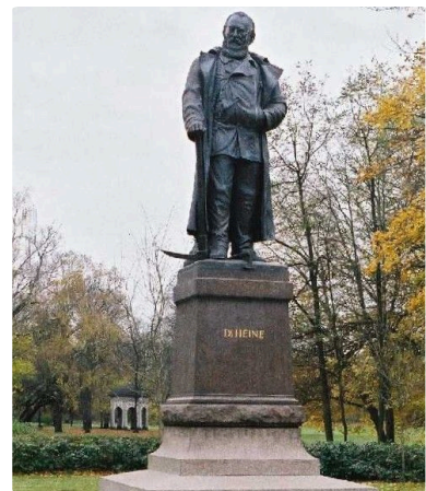
Q3 Carl-Heine-Denkmal in Leipzig

M9: Hier geht's zum Denkmal https://t1p.de/heinedenkmal