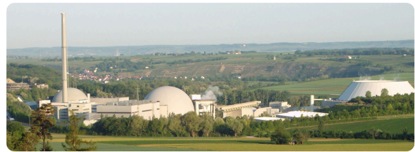
Atomkraftwerk GKN Neckarwestheim

Die Nutzung der freiwerdenden Energie bei einigen Kernreaktionen ist sicherlich prägend für das Bild von "Radioaktivität". Einerseits ist da die Atombombe d.h. die militärische Nutzung und auf der anderen Seite die Nutzung zur Energiegewinnung. Wie funktioniert das aber eigentlich? Das werdet ihr in etwas zusammengefasster Form nun erarbeiten