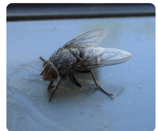
die Fliege / -n