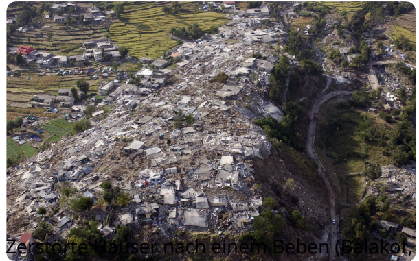
Zerstörte Häuser nach einem Beben (Balakot, Indien)

Jedes Jahr erhöht sich die Zahl der Umweltkatastrophen. Immer häufiger müssen Feuerwehrleute und oft auch Soldaten kräftezehrende lange Einsätze in Krisenregionen durchführen und für einige Menschen vor Ort kommt jede Hilfe zu spät.