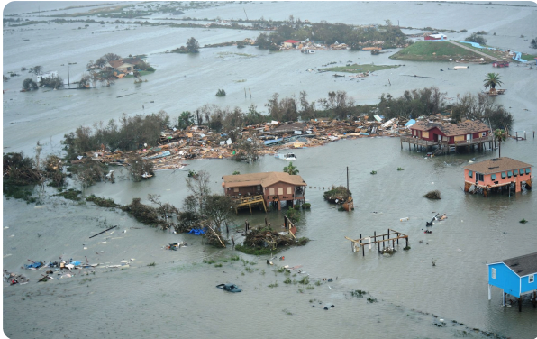
Überschwemmungen in Galveston (USA)

Taifun auf den Philippinen: Zahl der Toten auf über 30 gestiegen