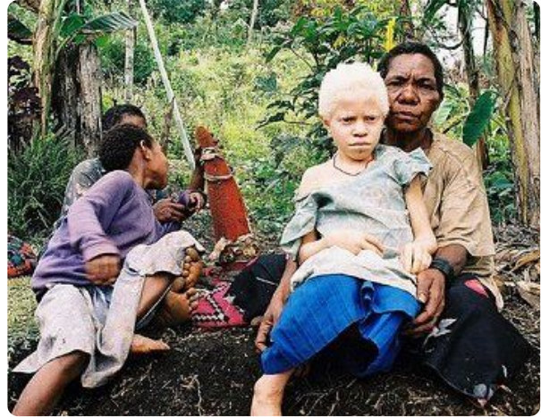
Mädchen mit Albinismus in Papua Neuguinea

Jeder Mensch besitzt zahllose körperliche Merkmale. Manche davon hat er im Laufe seines Lebens erworben (z. B. Narben) oder willentlich gestaltet (z. B. gefärbte Haare, Tattoos); die meisten seiner Merkmale sind jedoch das Ergebnis von Genwirkungen. Diese Merkmale werden also aufgrund von Informationen ausgeprägt, die der Mensch von seinen Eltern geerbt hat: Der Genotyp seiner Körperzellen bewirkt einen bestimmten Phänotyp . So führen verschiedene Enzyme, die aufeinanderfolgende Reaktionen katalysieren (Genwirkkette), zur Synthese der dunklen Pigmente (Melanine), die in Haut und Haare eingelagert werden. Liegt eines dieser Enzyme aufgrund einer Mutation seines Gens nicht in funktionstüchtiger Form vor, können keine Melanine gebildet werden: Haut und Haare des betreffenden Menschen sind in diesem Fall auffallend hell (Albinismus).