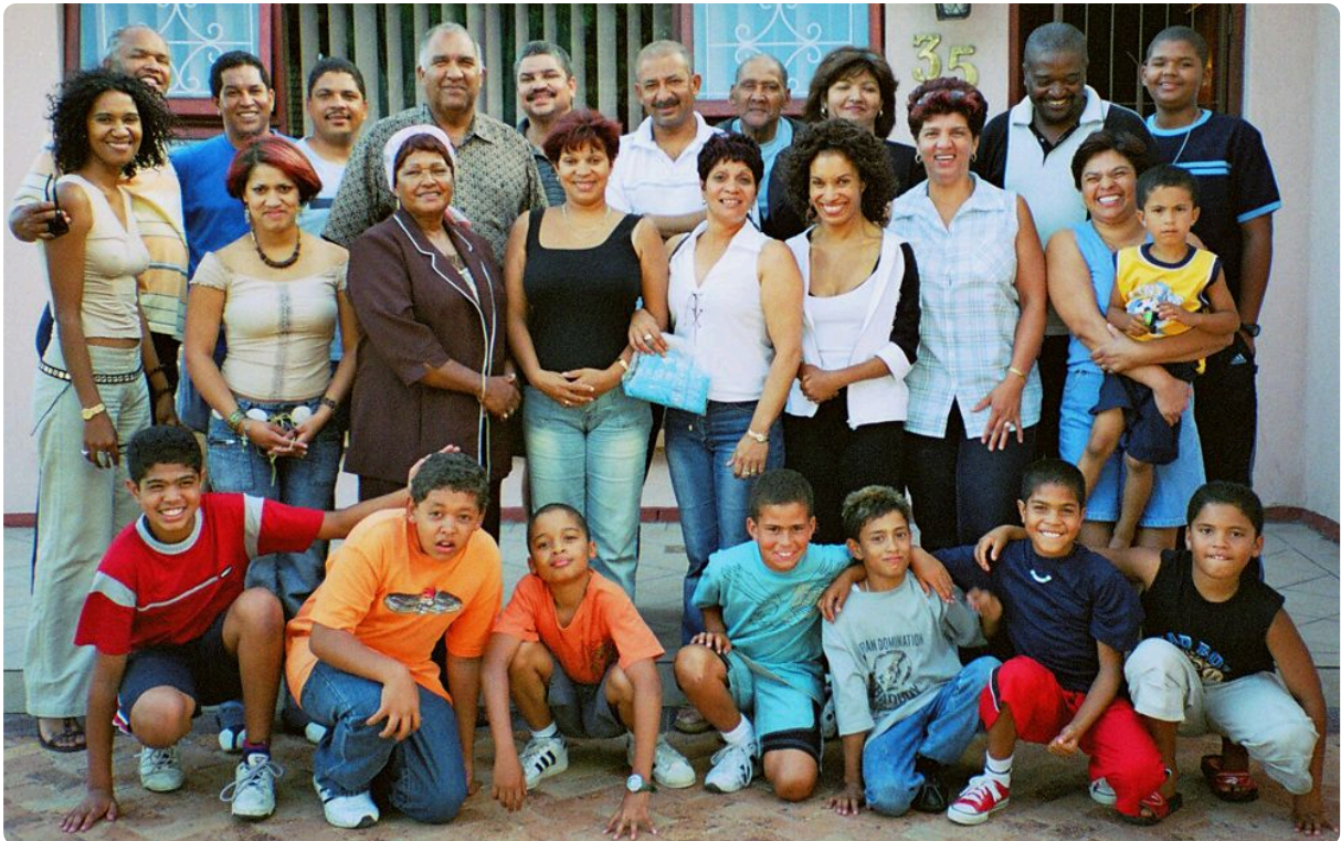
Eine Familie in Südafrika

Viele Merkmale des Körpers beruhen jedoch nicht nur auf einem einzelnen Gen/Enzym bzw. einer einzelnen Genwirkkette, sondern sind das Ergebnis des Zusammenwirkens einer ganzen Reihe von Genen/Enzymen und Genwirkketten, die gemeinsam zur Ausbildung eines bestimmten Phänotyps beitragen ( Polygenie ). So verhält es sich beispielsweise mit der konkreten Hautfarbe eines Menschen, allerdings ist bis heute noch nicht vollständig geklärt, wie viele Gene hier tatsächlich beteiligt sind. Man nimmt etwa vier Gene mit jeweils zwei Allelen an.