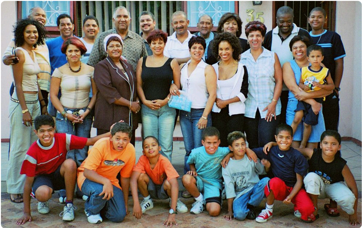
Eine Familie in Südafrika

Viele Merkmale des Körpers beruhen jedoch nicht nur auf einem einzelnen Gen/Enzym bzw. einer einzelnen Genwirkkette, sondern sind das Ergebnis des Zusammenwirkens einer ganzen Reihe von Genen/Enzymen und Genwirkketten, die gemeinsam zur Ausbildung eines bestimmten Phänotyps beitragen ( Polygenie ). So verhält es sich beispielsweise mit der konkreten Hautfarbe eines Menschen, allerdings ist bis heute noch nicht vollständig geklärt, wie viele Gene hier tat