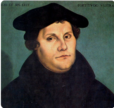
Martin Luther, 1529

① Wann (Jahr) und wo wurde Martin Luther geboren? / 2