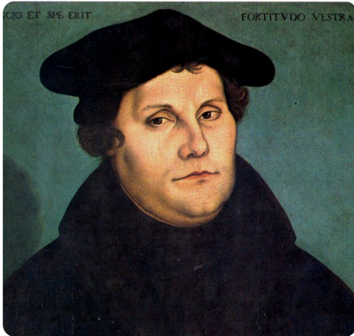
Martin Luther, 1529

① Wann (Jahr) und wo wurde Martin Luther geboren? / 2