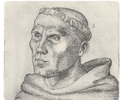
Luther als Augustinermönch.

⑤ An welchem Ort besuchte Luther NICHT die Schule oder Universität? Kreuze an! / 1