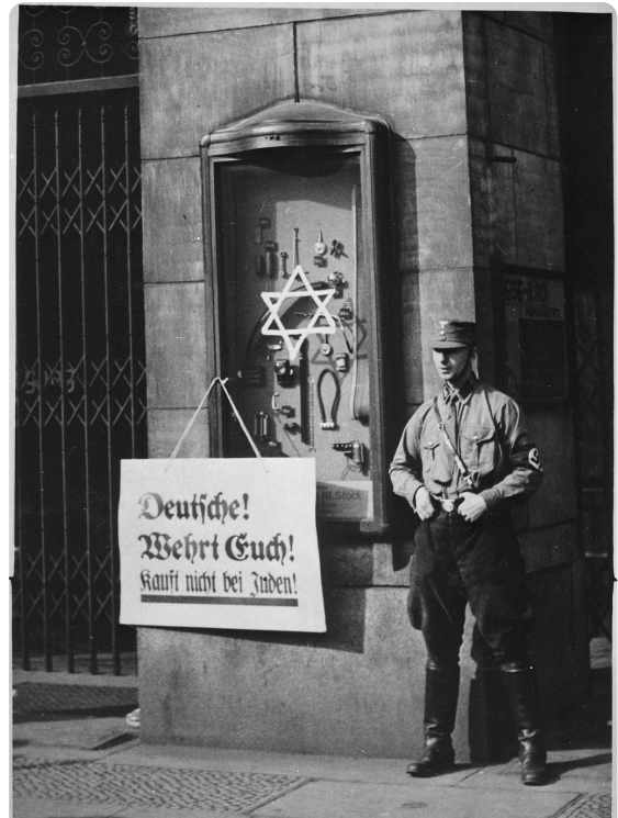
T2 Bildanalyse Boykott jüdischer Geschäfte