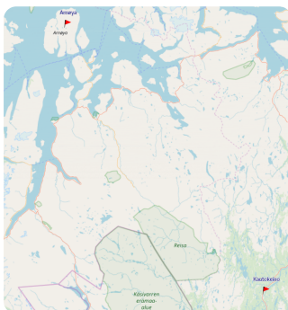
Kartenausschnitt der Wander- route aus dem Film

② Der Film ist schon über 30 Jahre alt. Überlege mit deiner Gruppe, wie sich das Leben der Rentiersamen seitdem verändert haben könnte.