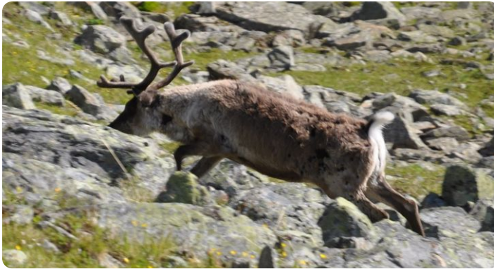
Rentier in der Nähe des Kebnekaise

Die Rentierzucht wird schon einige Tausend Jahre in den nördlichen Polargebieten betrieben. Zunächst folgten Jäger und Sammler nur den jährlichen Wanderungen der Tiere. Später griffen sie immer mehr in das Leben der Tiere ein, beschützten sie vor Raubtieren wie Wölfen oder Vielfraßen. Die jährliche Wanderung der Rentiere ist heute sehr stark beeinträchtigt durch z.B. Stausen, Straßen