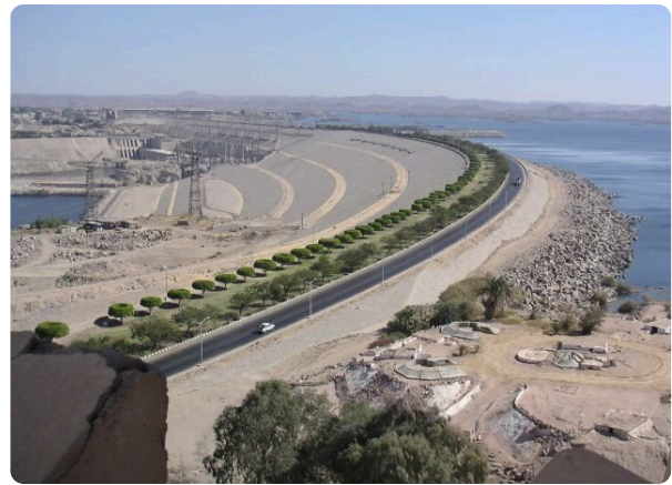
M8: Der Assuan-Staudamm im Jahr 2002

Der Assuan- Staudamm ist eine große Mauer, durch die der Nil zu dem ca. 500 Kilometer langen und 20 Kilometer breiten Nasser- See gestaut wird. Der Staudamm ist ca. 3,5 Kilometer lang und 110 Meter hoch. Der Staudamm sorgt dafür, dass die Felder das ganze Jahr Wasser zur Verfügung haben. Dadurch sind die Ägypter nicht mehr von den natürlichen Jahreszeiten des Nil abhängig.