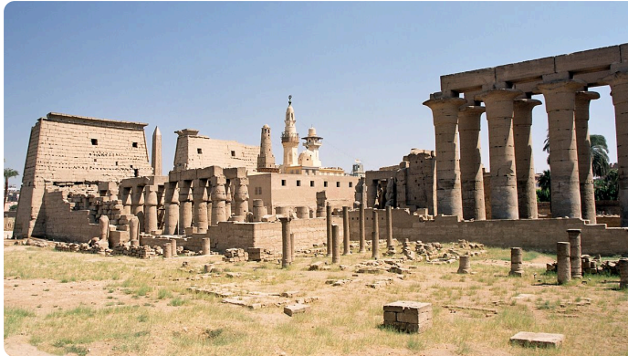
Der Tempel von Luxor im Jahr 2004