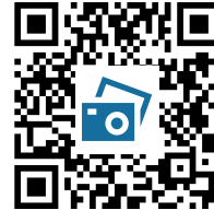
M7: Autry virtuell https://t1p.de/autryvirtuell