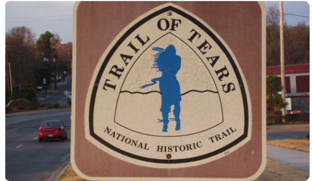
M6: Geschichtskultur: „Pfad der Tränen“