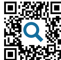
M8: Autry Sammlung digital https://t1p.de/autrysammlung

Für eine neue Ausstellung zur Geschichte des Amerikanischen Westens möchte das Museum das Gemälde "American Progress" ausstellen.