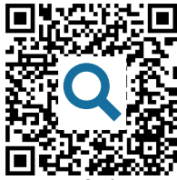
M5: Website https://t1p.de/tears