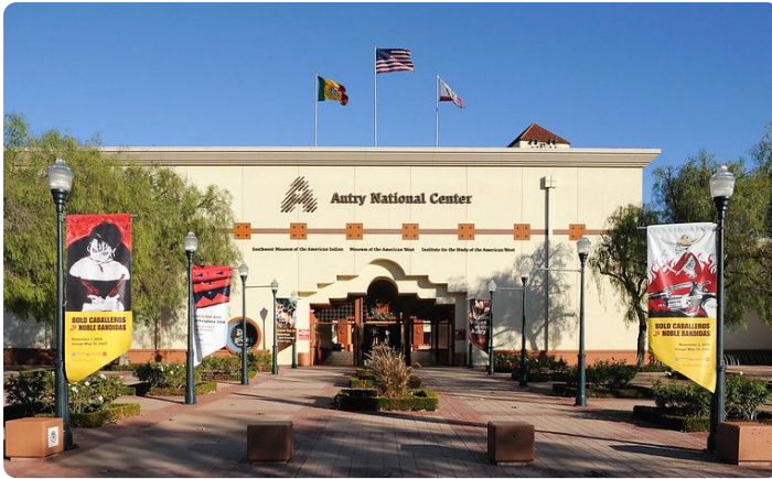
Eingang des Autry Museum in Los Angeles (2017)