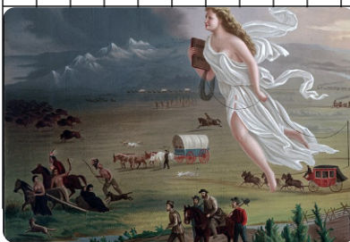
Q1: „American Progress“