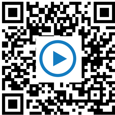
QR-Codes in Tutoring einfügen