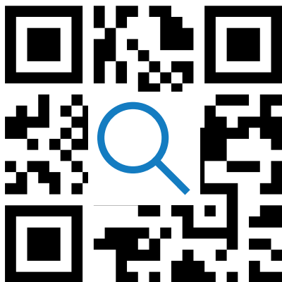
Was gibt dieser QR-Code