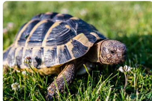
Zahlen: 3, 4