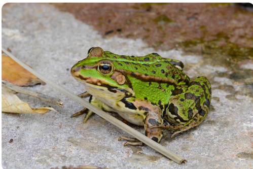
Zahlen: 5, 8