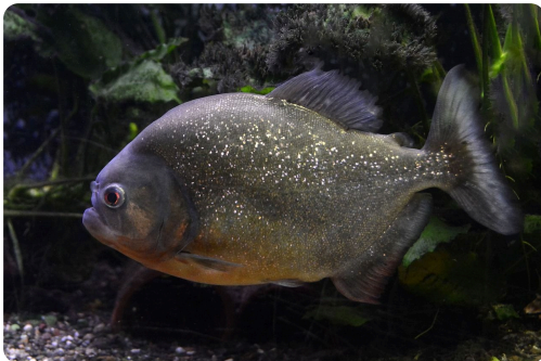
Zahlen: 2, 6