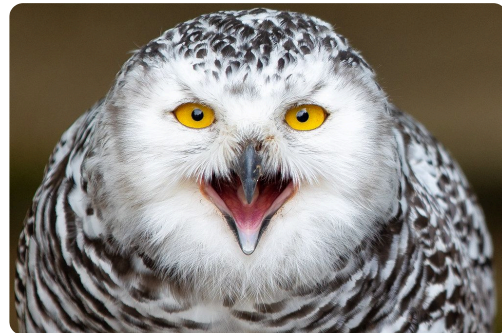
Zahlen: 1, 7