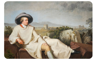
Goethe in der römischen Campagna

M A K R O M O L E K Ü L J Z A Ü H K Z W W B X Q E J I X F B X A X W J K E K Ä I Q N V Q L I Q Z E X J M W A G F Q E T Y E X A E J Q B H Q L P Z E Z Y E S D L T E Ü H T Q K E W B S B N T V F H G W V X W A F A Ö B B Ü E W M E Ü V I M Z N S L Ö R S V R H Ü R P O L Y V I N Y L C H L O R I D Z Q P P O L Y P R O P Y L E N Ü S K V G Y Q K T Ü B T A F G I R W Y L P O L Y E T H Y L E N H P U A O T H E R M O P L A S T W A D J R R K B R V W R P Z M Z Y V A Ö K D U R O P L A S T G Z P V