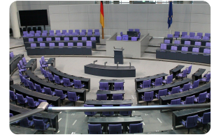
Der Deutsche Bundestag

Der Deutsche Bundestag, auch Parlament genannt, ist das einzige gesetzgebende Organ, das direkt vom Volk gewählt wird. Dieses Abreitsblatt beschäftigt sich damit, wie die Abgeordneten in den Bundestag kommen.