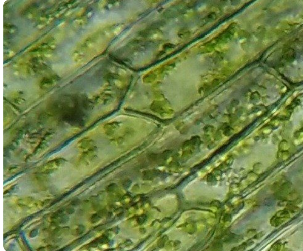
Abb. 1 — Pflanzliche Zelle einer Wasserpest unter dem Lichtmikroskop (ca. 400-fache Vergrößerung)

Beschrifte dafür das untere Bild, wobei jedes von Dir beschriebene Teil der Zelle mit einem Pfeil markiert werden muss.