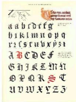
1 o Textura: 13. – 16. Jhdt.

Da das der feiser gefach da war zu rate mit den rufe meysteren de de rich waren wie es recht gemacht alle sach zu richte zu de richte om gantz gerecht da mit off das das die welt wunde fereubar und auch de das der bofe lute wbel dat und ar