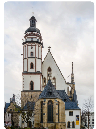
M4: Thomaskirche Leipzig (2013)

F E G E F E U E R O A B Q I Z R G O T T Ö X I T B U Z Z C D Y V R N P W T Ö L S E Ä O B M Ü Q U D M E S A S N W M E J H H A Ä A U M S E G S P E H A I V Ö U F Ö S X E Ü U E H J M X M S E Y B S L N T R Ö Q M S H G L V R Ä W D E E L W E Y B Z K H I W D E R V L Ü L A F F A W E Z S T A T E M Ü E O F E E F T O Ä