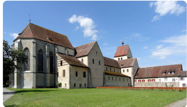
M15: Kloster Reichenau (2013)