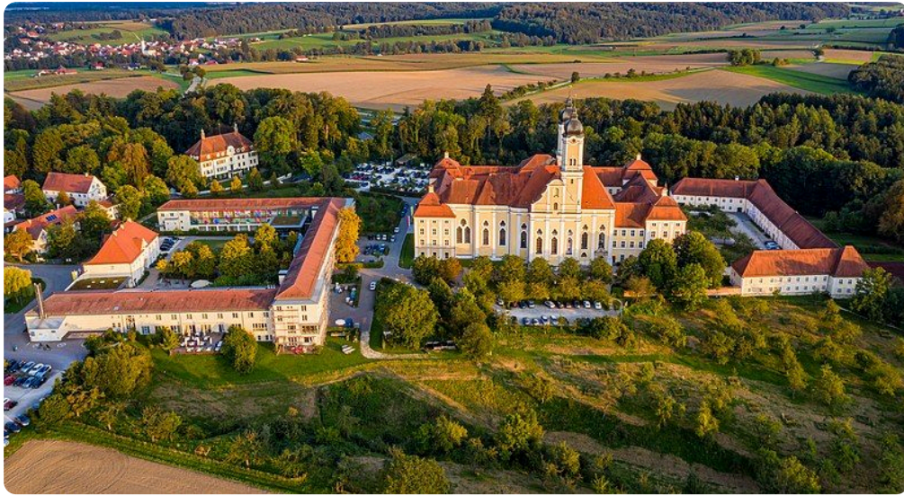
M17: Kloster Roggenburg (2019)