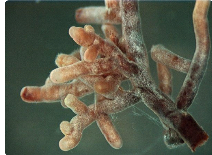
Wurzelspitzen mit Ektomykorrhiza mit einer Amanita-Pilzart