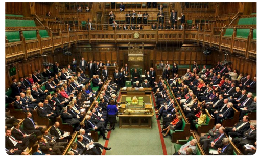
Das House of Commons, das Parlament von Großbritannien wird im Mehrheitswahlsystem gewählt.

Um als Kandidat im Mehrheitswahlsystem in das Parlament gewählt zu werden, muss man im Wahlkreis die Mehrheit der Stimmen erlangen. Es gilt das Prinzip „ The winner takes it all “. Dadurch entstehen im Parlament üblicherweise deutliche Mehrheiten. Allerdings bedeutet es auch, dass die Stimmen, die den unterlegenen Kandidaten gegeben wurden, im Parlament nicht repräsentiert werden. So kann es vorkommen, dass eine Partei die eine Mehrheit im ganzen Land hat, nicht die Mehrheit der Mandate im Parlament erlangt.