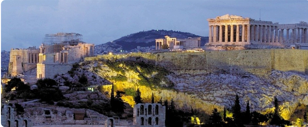
M2: heutige Sicht auf die Akropolis (=Burgberg) Athens