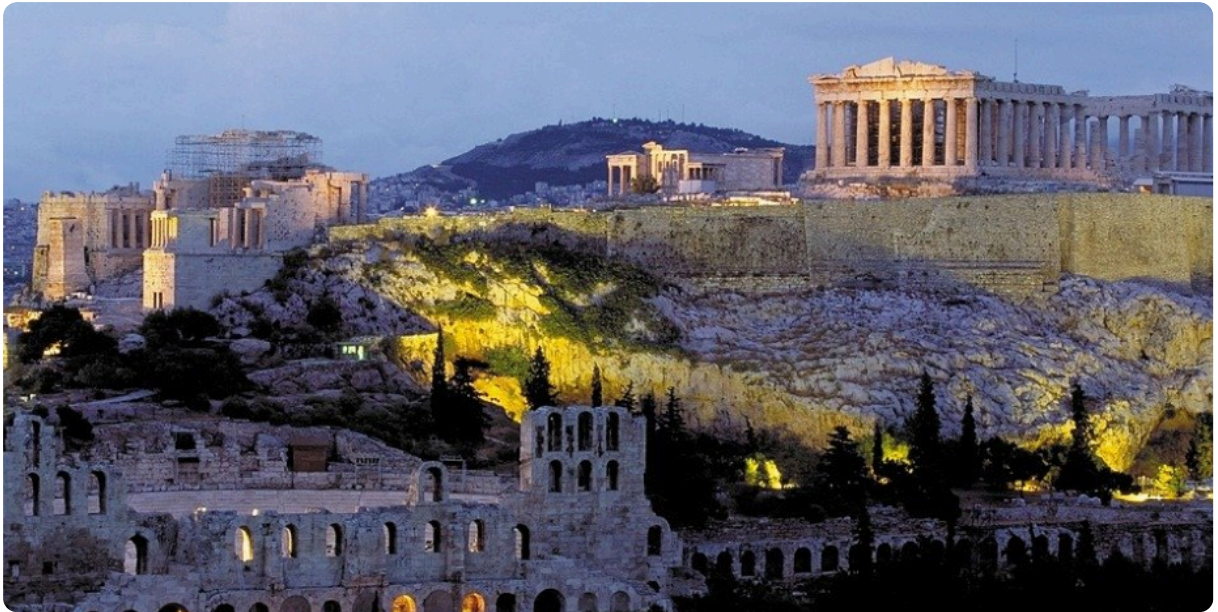
M2: heutige Sicht auf die Akropolis (=Burgberg) Athens